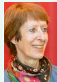
a cura di Elena Cereghetti